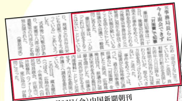
▲平成20年9月26日(金)中国新聞朝刊